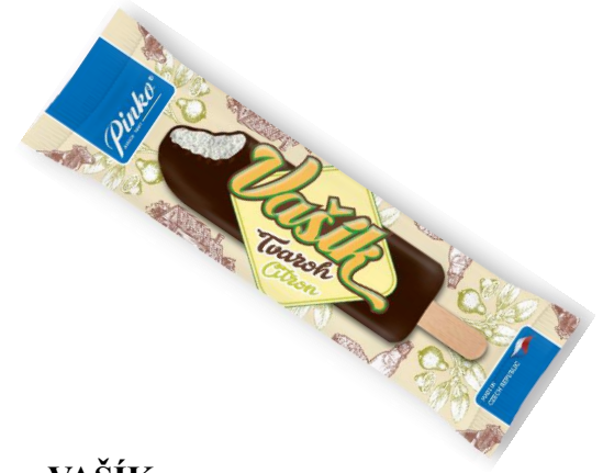
VAŠÍK TVAROHOVÝ (20% TVAROHU) 50ml, 48ks/krt