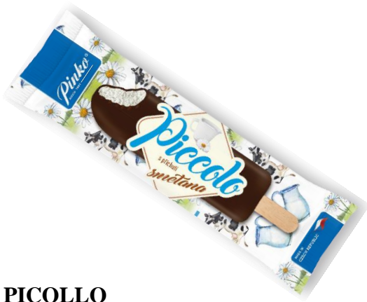
PICOLLO SMETANOVÝ V KAKAOVÉ POLEVĚ 50ml, 48ks/krt