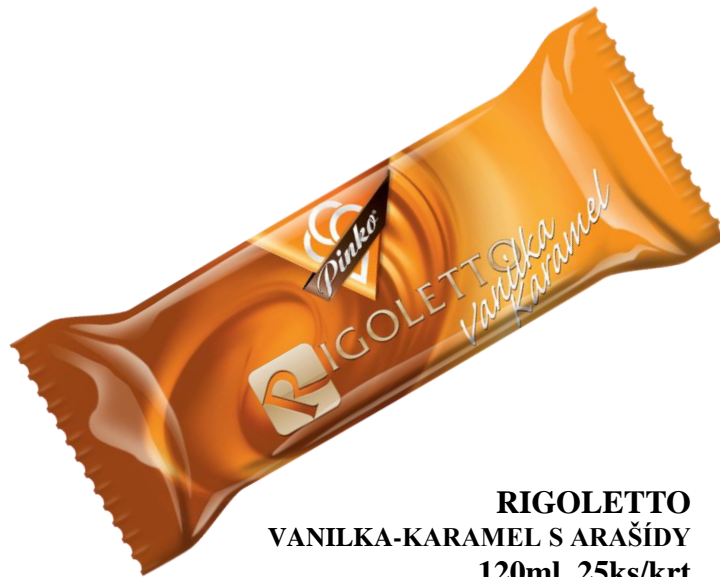
RIGOLETTO VANILKA-KARAMEL S ARAŠÍDY 120ml, 25ks/krt