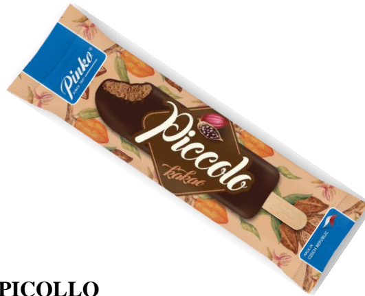
PICOLLO ČOKOLÁDOVÝ V KAKAOVÉ POLEVĚ 50ml, 48ks/krt