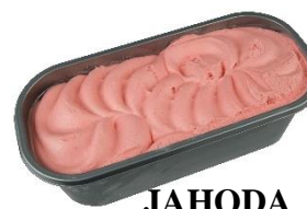
JAHODA S KOUSKY JAHOD