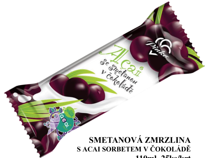
SMETANOVÁ ZMRZLINA S ACAI SORBETEM V ČOKOLÁDĚ 110ml, 25ks/krt