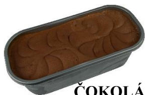
ČOKOLÁDA S KOUSKY ČOKOLÁDY